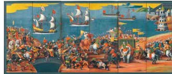
重要文化財 レバント戦闘図・世界地図屏風(右隻)江戸時代 17世紀 村山コレクション