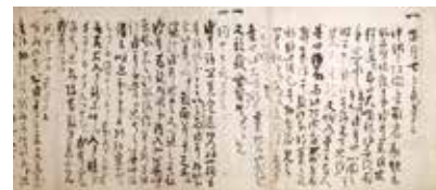
夢記 鎌倉時代 13世紀 村山コレクション(全期間展示)

とがのお 京都・梅尾の高山寺を開創した鎌倉時代の学僧明恵上人(1173～1232)が自分の夢を長年にわたって記した「夢記」をてがかりに、その人物像に焦点をあてる展覧会。高山寺所蔵の国宝「鳥獣戯画」(全四巻)も公開します。