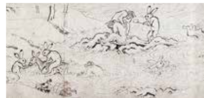
国宝 鳥獣戯画 甲巻 平安時代 12世紀 高山寺蔵(前期3月21日～4月14日展示)