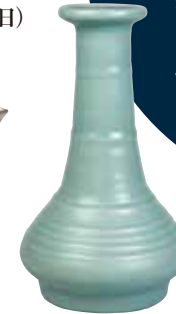
龍泉窯 青磁菊花入 南宋時代 13世紀 村山コレクション

2019年 展覧会 スケジュール ※作品保護のため、会期中一部展示替えがあります