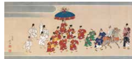
原在中筆 御蔭祭図巻 江戸時代 18世紀 村山コレクション