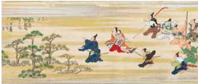
岩佐又兵衛筆 堀江物語絵巻 江戸時代 17世紀 村山コレクション