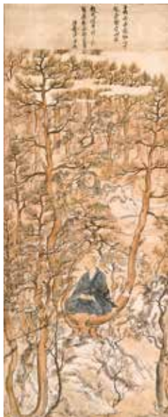
国宝 明恵上人像(樹上坐禅像) 鎌倉時代 13世紀 高山寺蔵 (後期4月16日～5月6日展示)

とがのお 京都・梅尾の高山寺を開創した鎌倉時代の学僧明恵上人(1173～1232)が自分の夢を長年にわたって記した「夢記」をてがかりに、その人物像に焦点をあてる展覧会。高山寺所蔵の国宝「鳥獣戯画」(全四巻)も公開します。