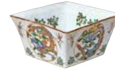
景德鎮窯 色絵団龍花卉文水指 明時代 17世紀 村山コレクション