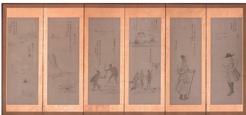
⑨司馬江漢筆、貫名海屋賛「異国風物図押絵貼屏風(左隻)」(文化9年、1812年か 個人蔵) 【後期】