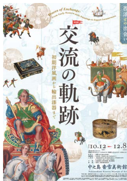
本展ポスター画像

2019年秋は、香雪美術館が所蔵する初期洋風 画の名品「レパント戦闘図・世界地図屏風」(重要 文化財)を軸に、日本と西洋が出会い、その交流の 精華として生み出された初期洋風画から輸出漆 器までを展示し、近世の日欧文化交流の軌跡を美 術の世界からたどります。