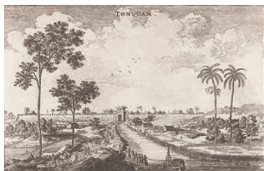
⑪ヨハン・ニューホフ著『オランダ東インド会社派遣使節中国紀行』蘭語再販 (1670年刊、アムステルダム刊 京都大学附 属図書館)