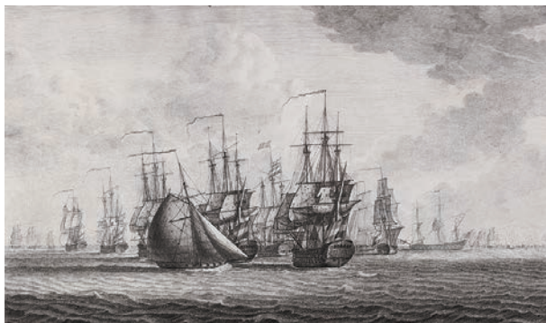
20 エンヘル・ホーヘル・ヘイデン画、ロバート・マイス彫版 「ドッガーバンク海戦図 危難に陥るオランダ艦バタフィール号」 (1785年、ミッデルブルフ刊 長崎歴史文化博物館)