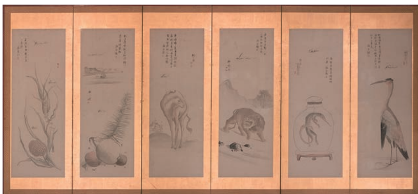
⑧司馬江漢筆、貫名海屋賛「異国風物図押絵貼屏風(右隻)」(文化9年、1812年か 個人蔵) 【前期】