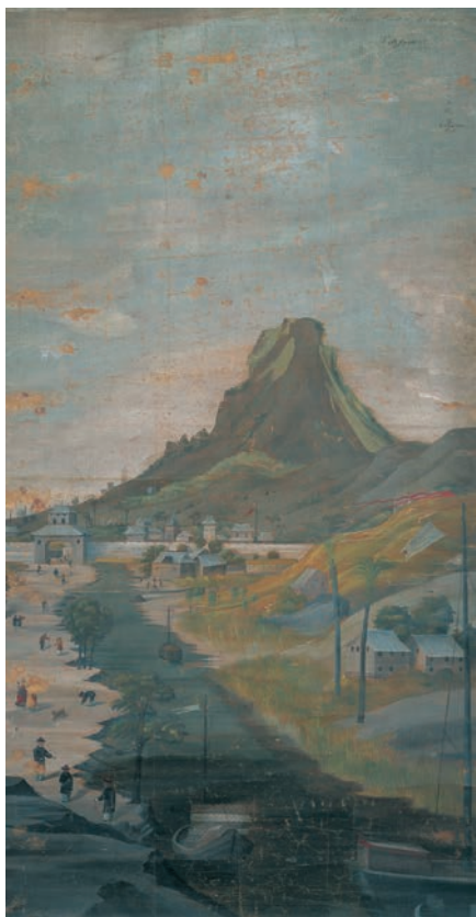
⑫司馬江漢筆「外国風景図」(寛政9年、1797 個人蔵)