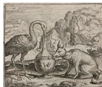
⑥ヨースト・ファン・デン・フォンデル著 マルクス・ヘーラーツ画・刻『動物の素晴らしき楽園』 (刊行年不明 アムステルダム刊 個人蔵)【後期】