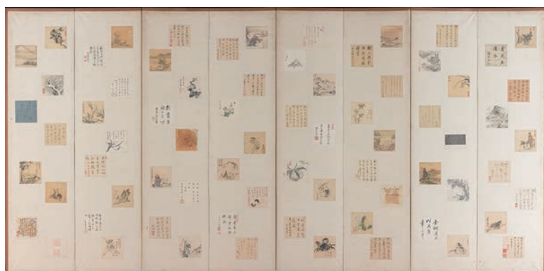
⑦司馬江漢・石川大浪ほか筆「方三寸画帖貼交屏風(左隻)」(天明1781-89頃 個人蔵)