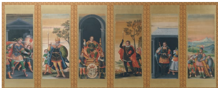
③重要文化財「泰西王侯図屏風(右隻)」(桃山～江戸時代初期、17世紀初期 長崎歴史文化博物館) 【前期】