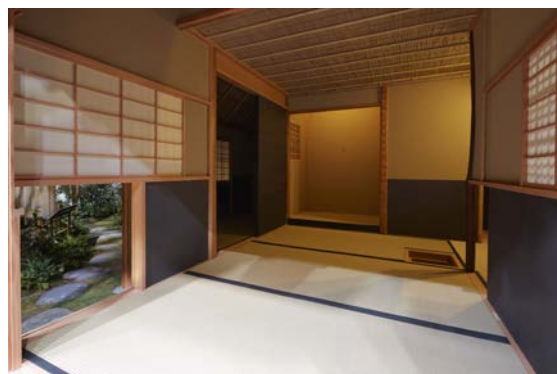
茶室「中之島玄庵」内部