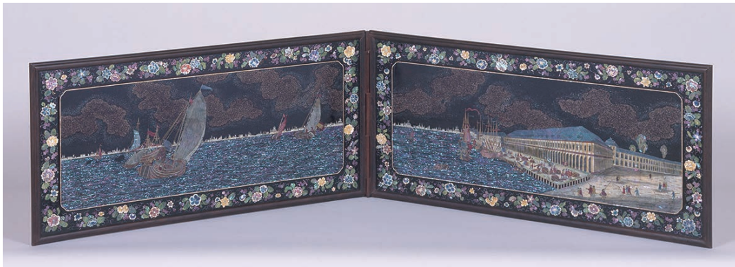
17「西洋港図螺鈿風炉先屏風」(江戸時代、19世紀 長崎歴史文化博物館)