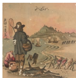
⑦司馬江漢筆 「方三寸画帖貼交屏風(左隻部分)」 (天明1781-89頃 個人蔵)