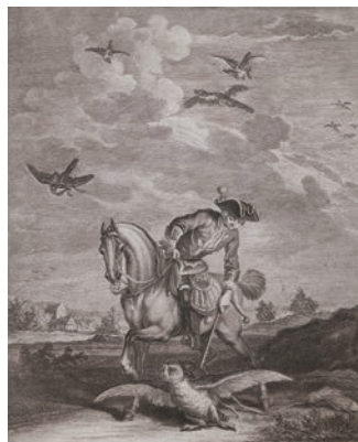
⑬ヨーハン・エリアス・リーディングー画・刻「狩獵家と鷹匠」(1764年頃、アウクスブルク刊 神戸市立博物館) 【後期】