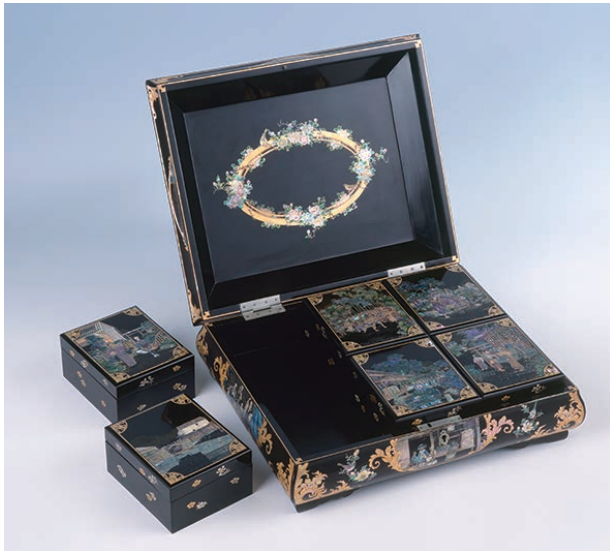
18「長崎風物図螺鈿箱」(江戸～明治時代、19世紀 長崎歴史文化博物館)