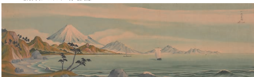
⑮司馬江漢筆、奥田尚齋識付「駿州薩陀山富士遠望図」(享和3年、村山コレクション)