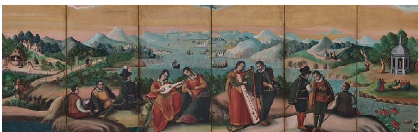
④重要文化財「洋人奏楽図屏風(右隻)」(桃山~江戸時代初期、17世紀初期 MOA美術館) 【10月12日~10月27日】