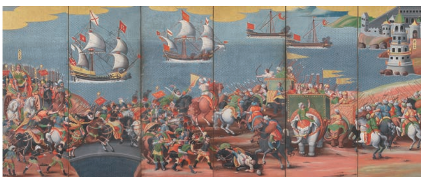
①重要文化財「レパント戦闘図・世界地図屏風(右隻)」(江戸時代初期、17世紀初期 香雪美術館)

「花鳥図屏風」(⑤) — 日本の屏風の影響でできたビオンボに潜むイソップ物語(⑥)