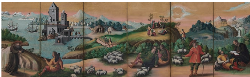
⑤重要文化財「洋人奏楽図屏風(左隻)」(桃山~江戸時代初期、17世紀初期 MOA美術館) 【10月29日~11月10日】