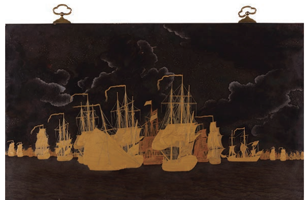
19「ドッガーバンク海戦図蒔絵プラーク 4」(江戸時代、18世紀末期 長崎歴史文化博物館)