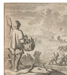
⑩-Aヤン・ルイケン、 カスベル・ルイケン父子著『人間の職業』 (1730年、アムステルダム刊 個人蔵)