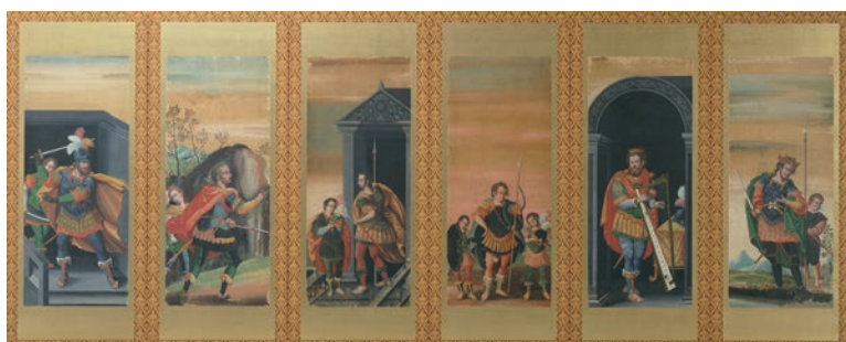
③重要文化財「泰西王侯図屏風(左隻)」(桃山～江戸時代初期、17世紀初期 長崎歴史文化博物館) 【後期】