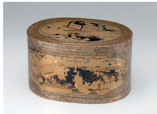
16「伊勢・源氏物語蒔絵螺鈿合子」(江戸時代、17世紀 南蛮文化館)