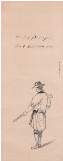
⑨司馬江漢筆「銃を持つ人物」(文化10年 1813 個人蔵)