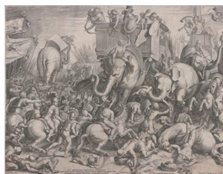
②コルネリ・コルト彫版、ジュリオ・ロマーノ原画、ラファエロ原作「ザマの戦い」(1602年、ローマ刊 香雪美術館)