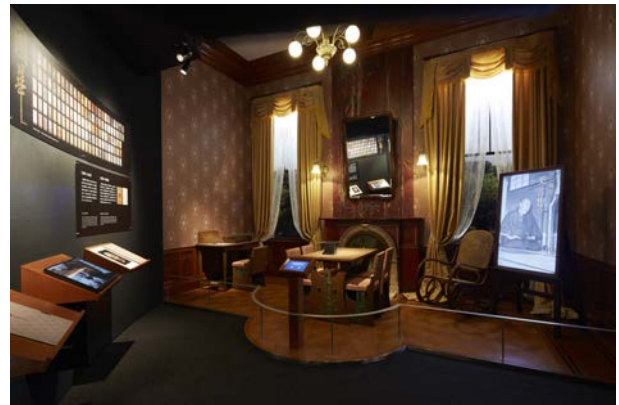
村山龍平記念室 洋館2階居間の再現