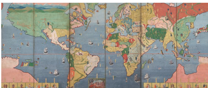
③重要文化財「レパント戦闘図・世界地図屏風(左隻)」(江戸時代初期、17世紀初期 香雪美術館)