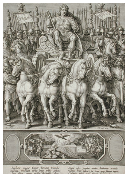
参考図版 コラールト彫版、ストラダノ原画「古代ローマ皇帝図集」 屏絵(1587~89年頃)ロサンゼルス・カウンティ美術館 ※出品されません