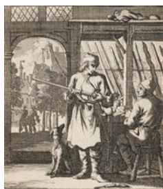
⑩-Bヤン・レイケン、カスベル・レイケン父子著「人間の職業」(1730年、アムステルダム刊 個人蔵)