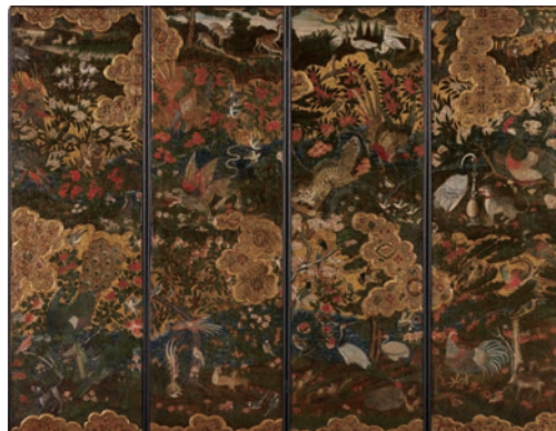
⑤「花鳥図屏風」(中国 マカオ、17～18世紀 九州国立博物館) 【後期】