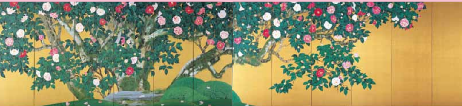
1.「建仁寺茶碑「春うらら」」2003年、祇園つじりグループ蔵／2.「日」2009年、リベラ株式会社蔵／3.「月」2009年／4.「白日」1986年、和歌山市立博物館蔵／5.「雨後」1992年、リベラ株式会社蔵／6.「生きる」2011年、リベラ株式会社蔵／7. 散華「百合の谷」2002年、薬師寺蔵／8.「終野五色椿」屏風 2007年、リベラ株式会社蔵