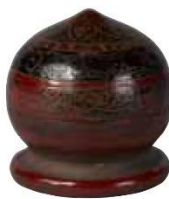
中国・東南アジア《独楽煙草入》 16~17世紀