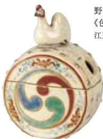
野々村仁清 《色絵諷鼓鶏形香炉》 江戸時代、17世紀