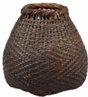
《桂籠花入》 桃山時代、16世紀