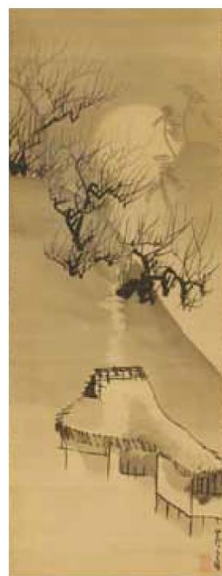
長沢芦雪《山家寒月図》 江戸時代、18世紀