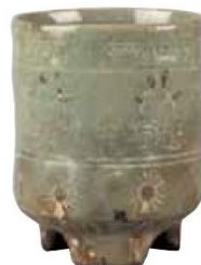
朝鮮《御本雲鶴筒茶碗》 朝鮮時代、17~18世紀