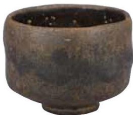
長次郎《黒楽茶碗 銘 古狐》 桃山時代、16世紀