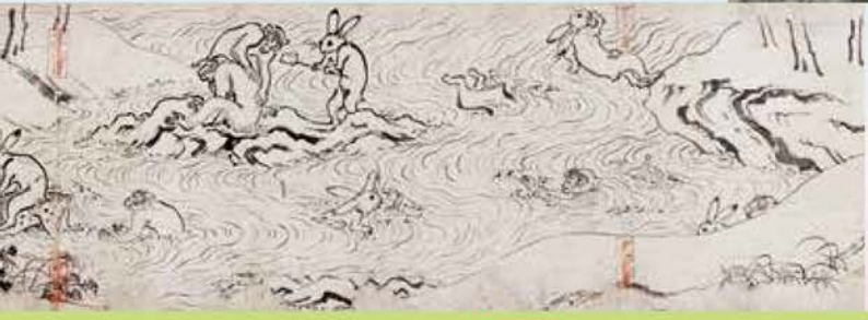
前期 国宝 鳥獣戯画甲巻 平安時代 京都・高山寺蔵

ウサギや蛙、幻想的な聖獣が躍動する甲巻・乙巻は前期に、動物とともに滑稽味あふれる人の世界を描き出した丙巻・丁巻は後期に展示します。明恵の夢の世界と一脈通ずる鳥獣戯画の世界をご堪能ください。