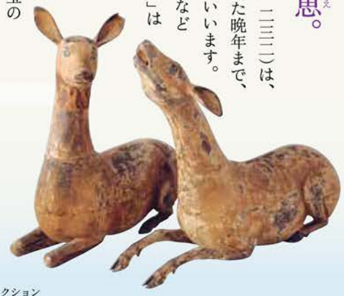
重要文化財 神鹿 鎌倉時代 京都・高山寺蔵