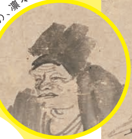
重要文化財 因陀羅 維摩居士圖 元時代(14世紀)