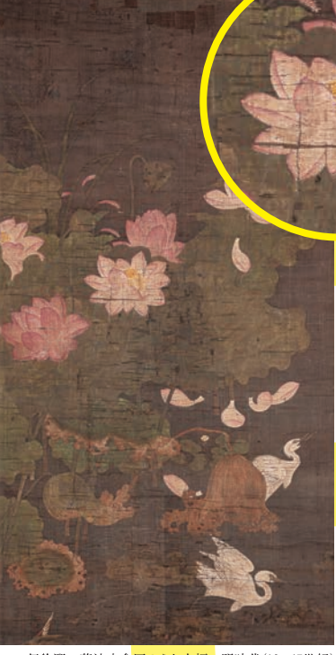
伝徐熙 蓮池水禽図のうち右幅 明時代(16~17世紀)