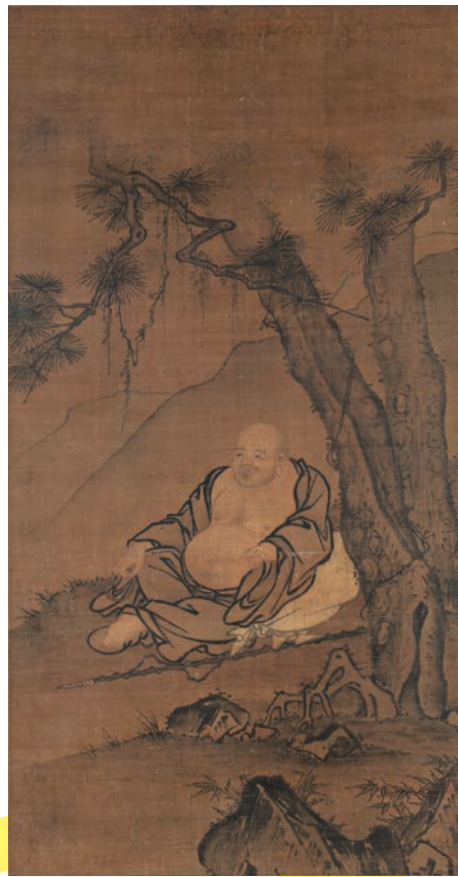
伝蒋子成 松下布袋図 明時代(15~16世紀)