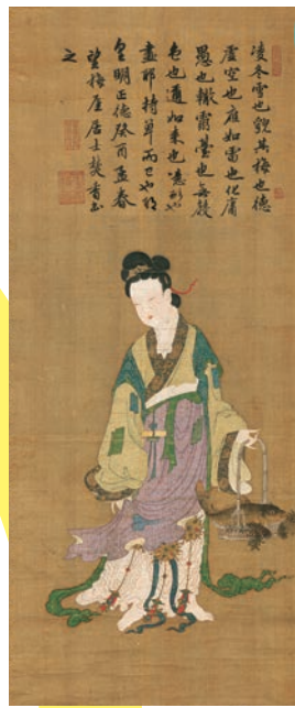
伝周文 白衣観音像 室町時代(15、16世紀) 伝銭舜举 魚籃観音図 明時代 正徳8年(1513)賀