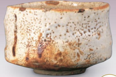
美濃 志野茶碗 銘 広沢 湯木美術館 桃山時代（16-17世紀）