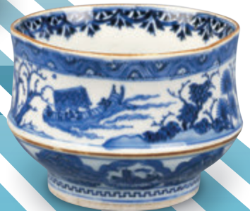
景德鎮窯 祥瑞山水花鳥文洲浜形茶碗 明時代（17世紀）

茶道具を所蔵する関西の美術館・博物館9館が緩やかに連携します。入館料の相互割引を検討中です。