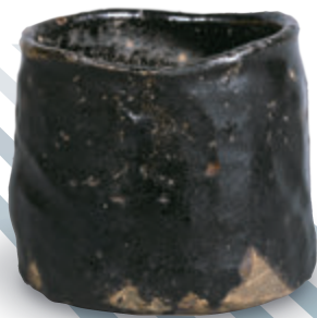
美濃 瀬戸黒茶碗 銘 宗潮黒 桃山時代（16-17世紀）