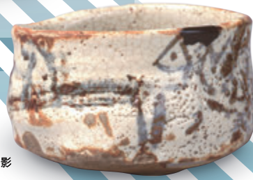
美濃 志野茶碗 銘 朝日影 桃山時代（16-17世紀）