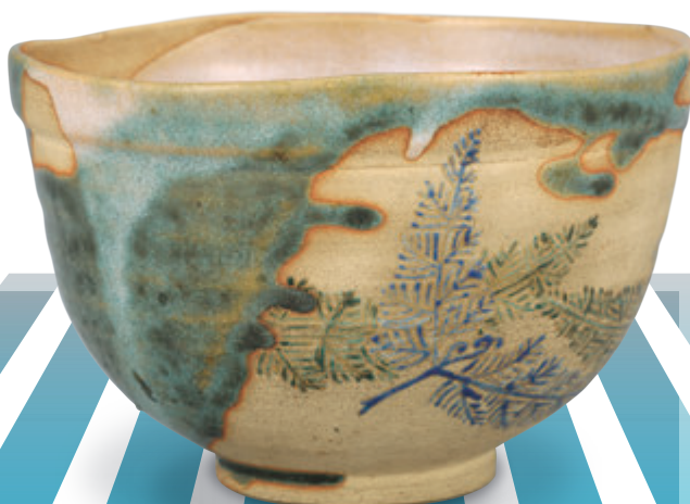
野々村仁清 色絵忍草文茶碗 江戸時代前期(17世紀)