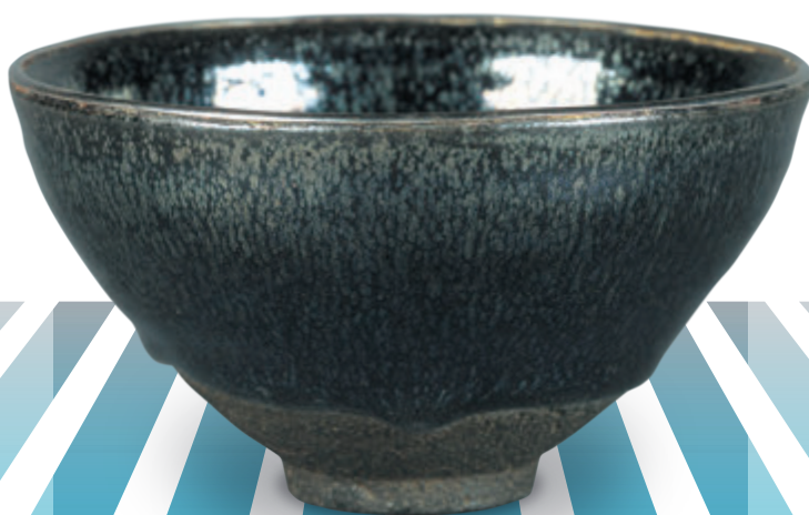
建業 油滴天目 南宋時代(12-13世紀)

中之島香雪美術館 Nakanoshima Kosetsu Museum of Art