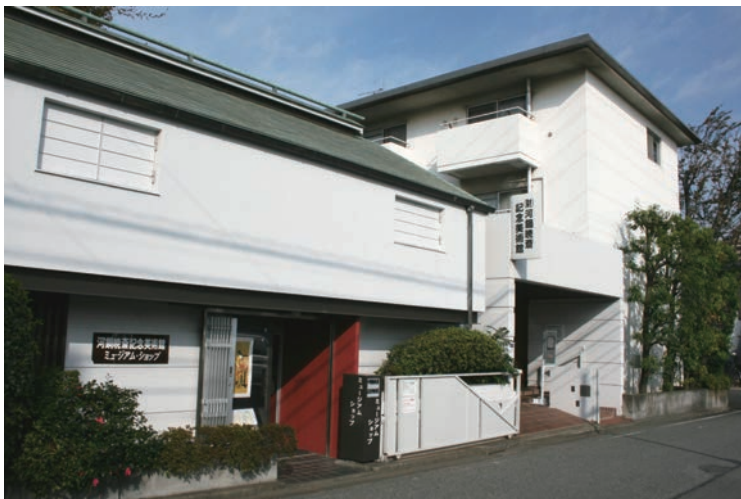
河鍋暁斎記念美術館外観

現在、河鍋暁斎記念美術館は、河鍋家に遺された暁斎・暁翠の下絵や画稿類を中心に、後に購入した肉筆画や錦絵も含め、3,500点ほどの作品を所蔵しています。また展示数は40点前後と小規模ながら、2か月に一度すべての作品を展示替えする企画展を開催し、国内外から暁斎ファンが来館しています。