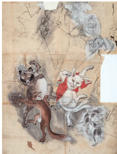
③河鍋暁斎《鳥獸戯画猫又と狸下絵》 河鍋暁斎記念美術館蔵