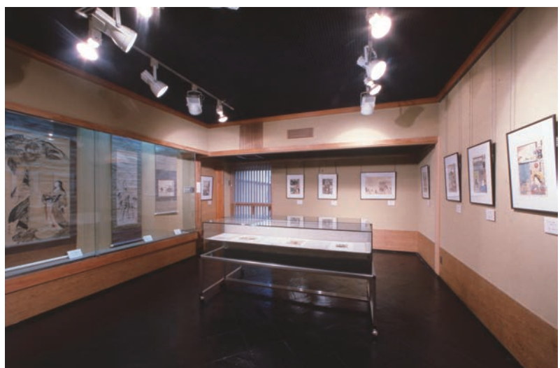
河鍋暁斎記念美術館第一展示室