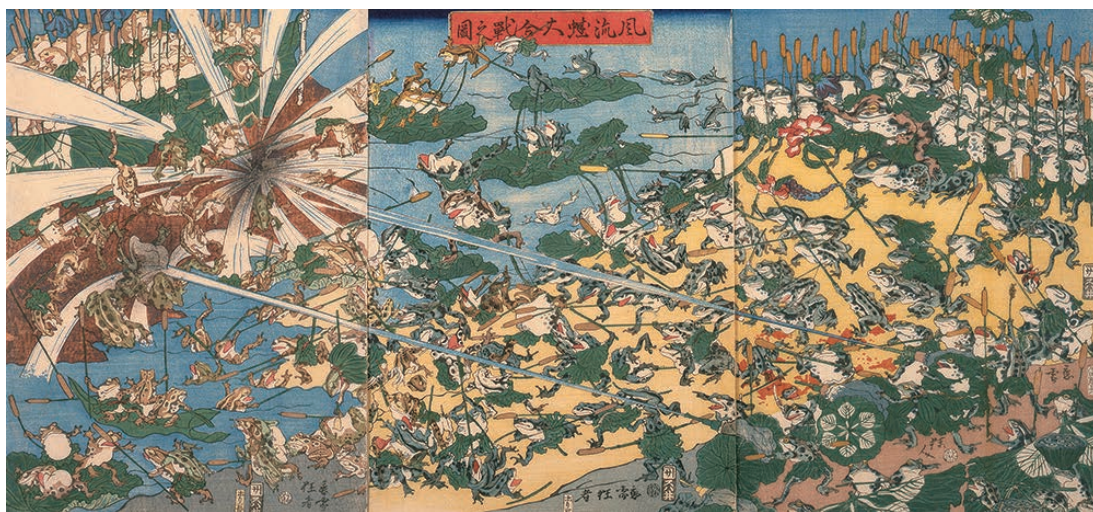
①河鍋暁斎《風流蛙大合戦之図》元治元年(1864) 河鍋暁斎記念美術館蔵【前期:4/26~5/11】※後期は異版を展示

狩野派での修業や、中国絵画の模写、浮世絵版画も手掛けた時代の作例からは、歴史のはざままで模索を続ける姿が浮かび上がります。