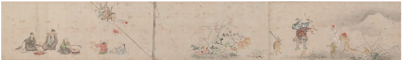
伝狩野探幽《戯画図巻》(部分) 江戸時代(17世紀) 香雪美術館蔵 ※場面替えあり

画業 いしずえ の礎となった狩野派や、さらに狩野派が規範とし、かつ目指した中国絵画を紹介し、暁斎以前の絵画の様相を垣間見ます。また、暁斎愛蔵の「戯画図巻」にも触れ、戯画も狩野派の伝統の一つと正当性を確信していたことも示します。